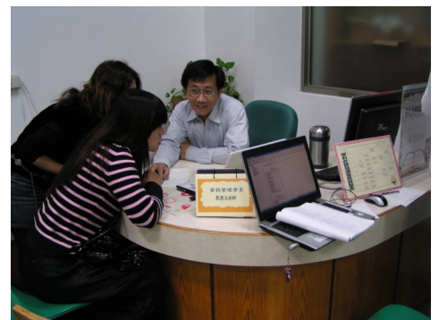
學科老師指導同學

99 學期下學期「學科老師指導服務」於 3/14 開始提供服務，歡迎同學多加把握，解決課業問題，並學會善用圖書館豐富資源，您會發現：圖書館真是一個兼具知識寶藏與休閒娛樂的好所在。